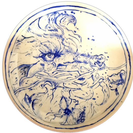
《龙》陶瓷彩绘 作者：李雅男 指导教师：聂建民