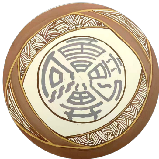
《鲁韵黄河》陶瓷彩绘 作者：宋雨阳