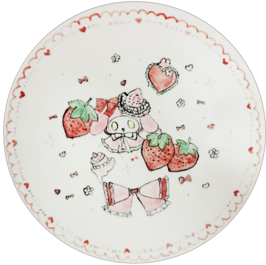
《草莓》陶瓷彩绘 作者：于涵 指导教师：聂建民