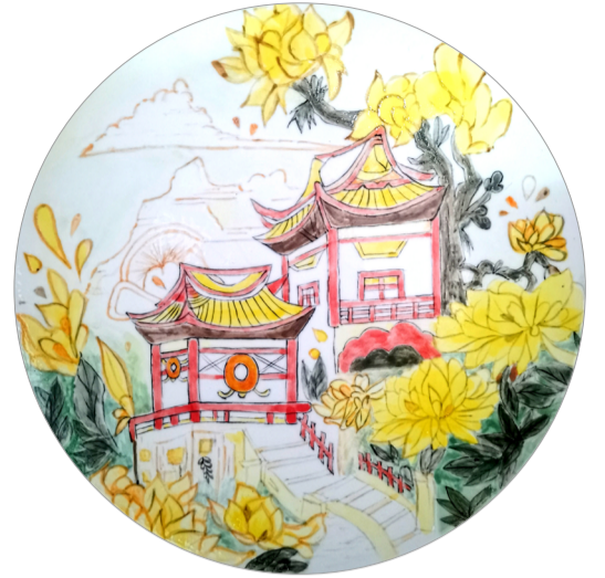
《独上西楼》陶瓷彩绘 作者：孙如梦 指导教师：聂建民