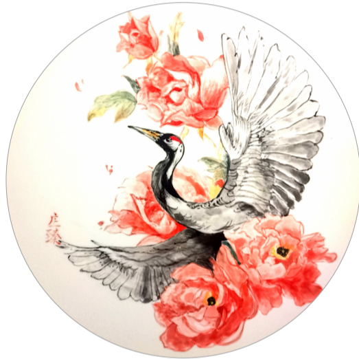
《鹤》陶瓷彩绘 作者：庄臻 指导教师：聂建民