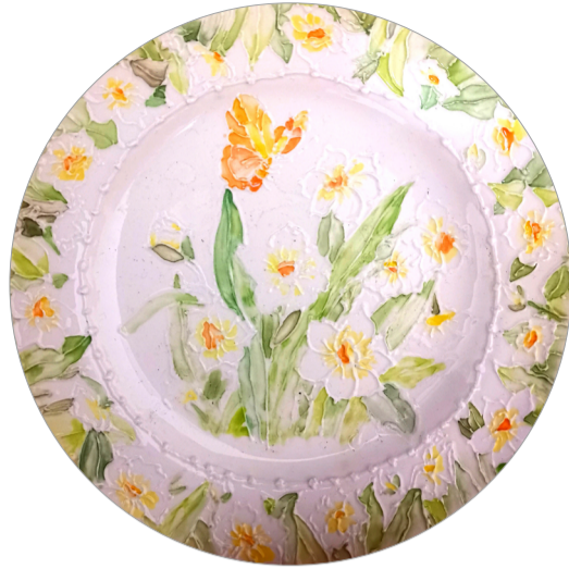
《春日物语》陶瓷彩绘 作者：徐新然 指导教师：聂建民