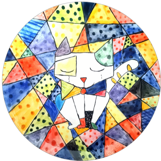
《几何猫》陶瓷彩绘 作者：邹美伊 指导教师：聂建民