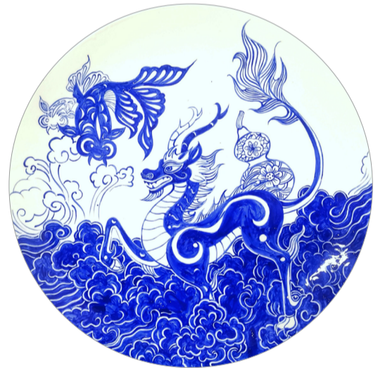
《鲁韵瓷脉-金麟承运》 作者：王逸文