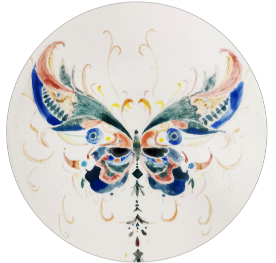
《化蝶》陶瓷彩绘 作者：王艺潺 指导教师：聂建民