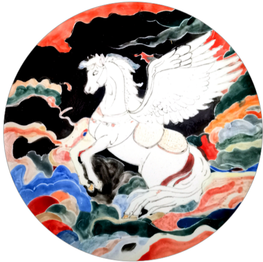
《飞天》陶瓷彩绘 作者：李宇霏 指导教师：聂建民