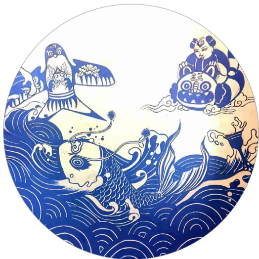
《鲁韵瓷脉-瑞兽嬉波》 作者：王逸文